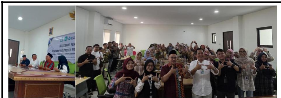
Gambar 2. Pemaparan Materi Edukasi Sertifikasi Halal